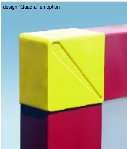
design "Quadra" en option