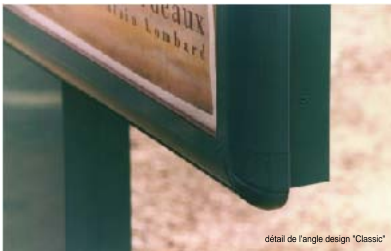
détail de l'angle design "Classic"