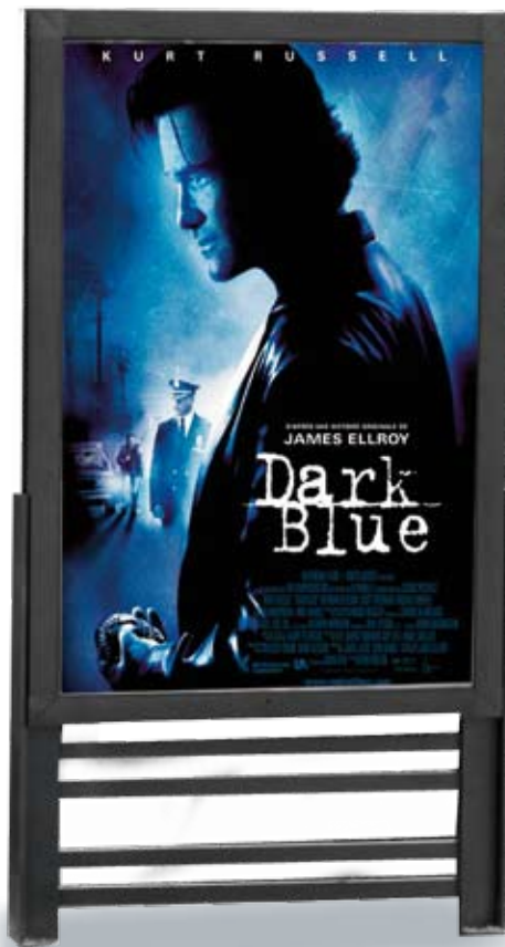
Profil du pied

Planimètre 2m 2 - Format d'affichage 1200 x 1800